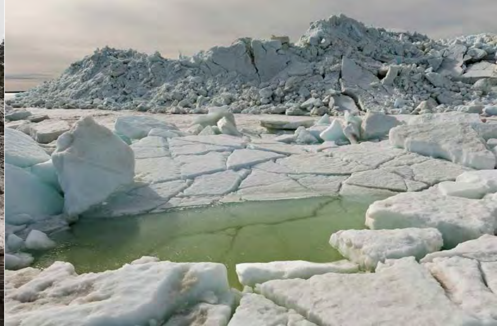
Korkeimmat ahtojäät Raumanmerellä neljään kymmeneen vuoteen, yli 11 metriä merenpinnasta, kohosivat Isolle Siliölle keväällä 2011

kuvia. Ovathan saaristokuvaajan ongelmat silti muutoksessa vähäisimpiä.