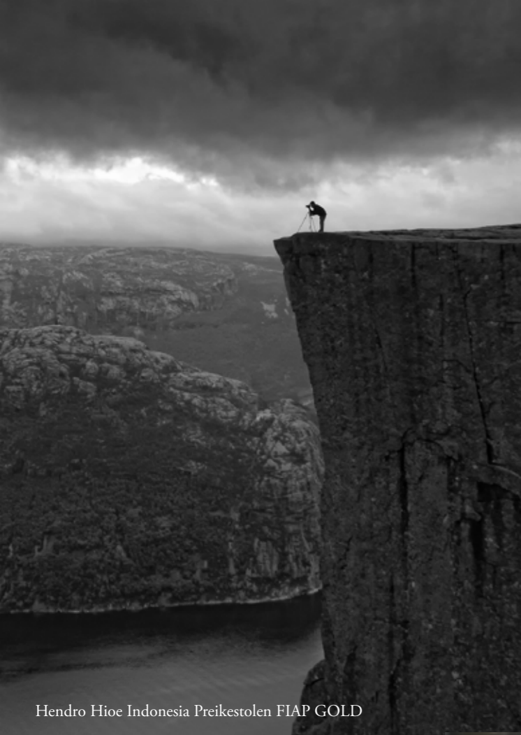
Hendro Hioe Indonesia Preikestolen FIAP GOLD