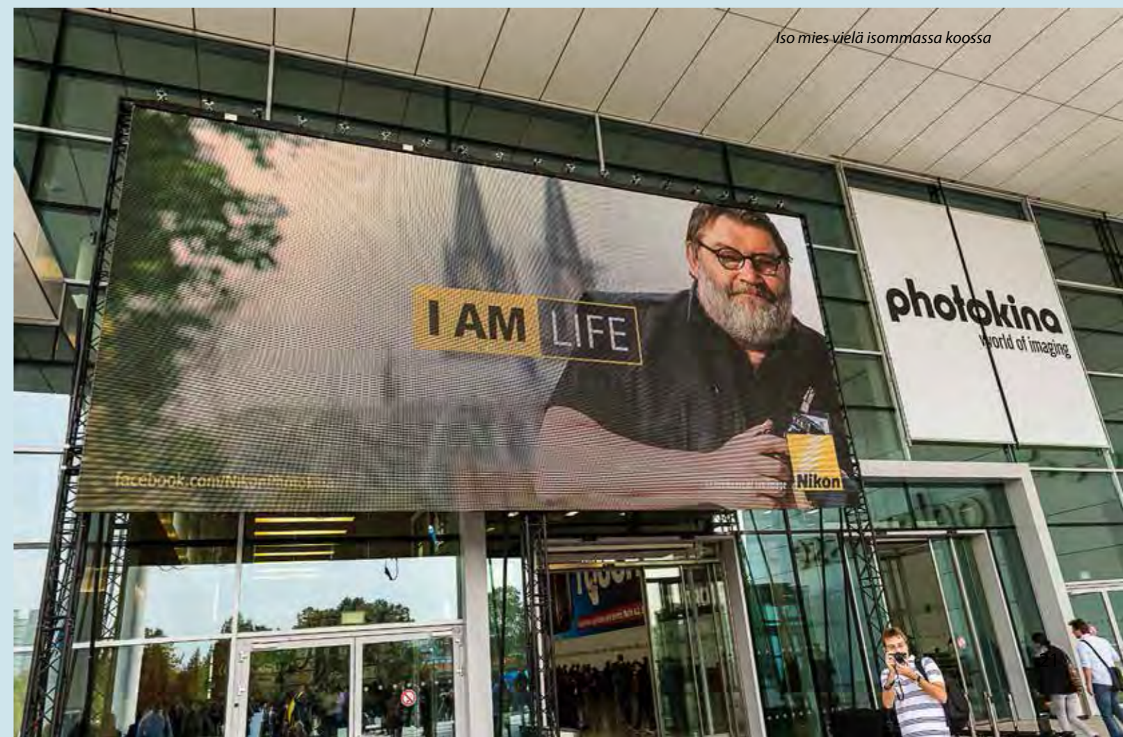
Iso mies vielä isommissa koossa

Studiovalaisimia oli esillä runsaasti - ei tosin mitään täysin uutta. Led-valaisimia olisi odottanut olevan esillä enemmänkin, mutta ilmeisesti riittävän tehokkaiden ledien valmistamisessa on vielä ongelmia. Pieniä valaisimia oli jonkin verran, mutta luonnollisesti niiden teho rajoittaa käyttöä. Parhaat käyttö-