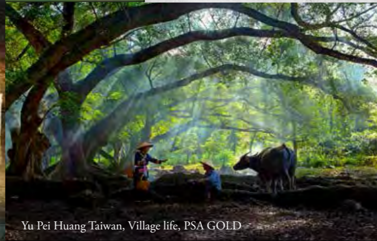
Yu Pei Huang Taiwan, Village life, PSA GOLD