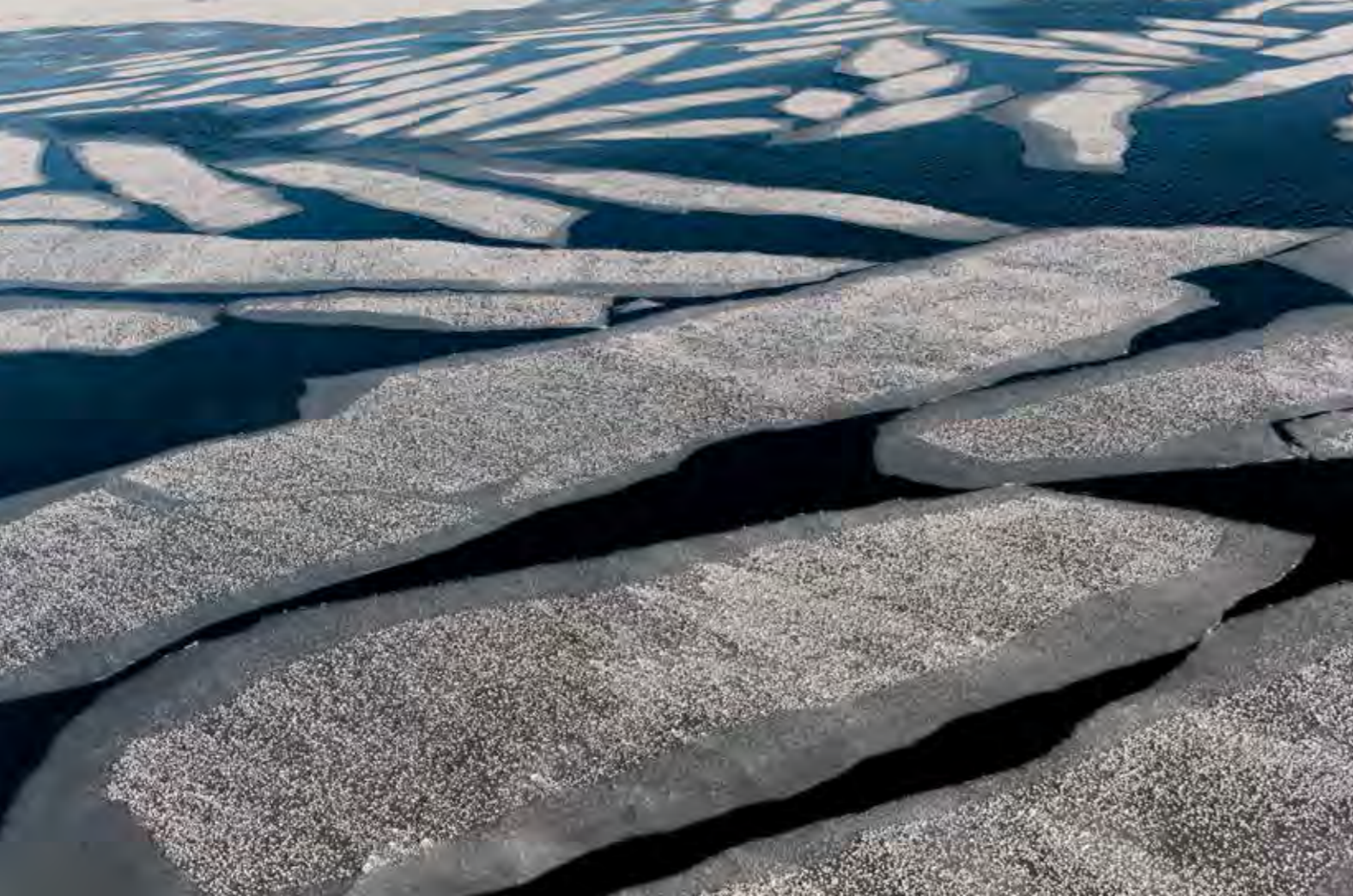
Jäätyvän tai sulavan jään reuna on elävää luonnon grafiikkaa varsin vaihtelevin muodoin

lähtöön kuului ensin paatin lumityöt, seitsemän sentin lumikuorman harjaus kuomulta ja täkiltä.