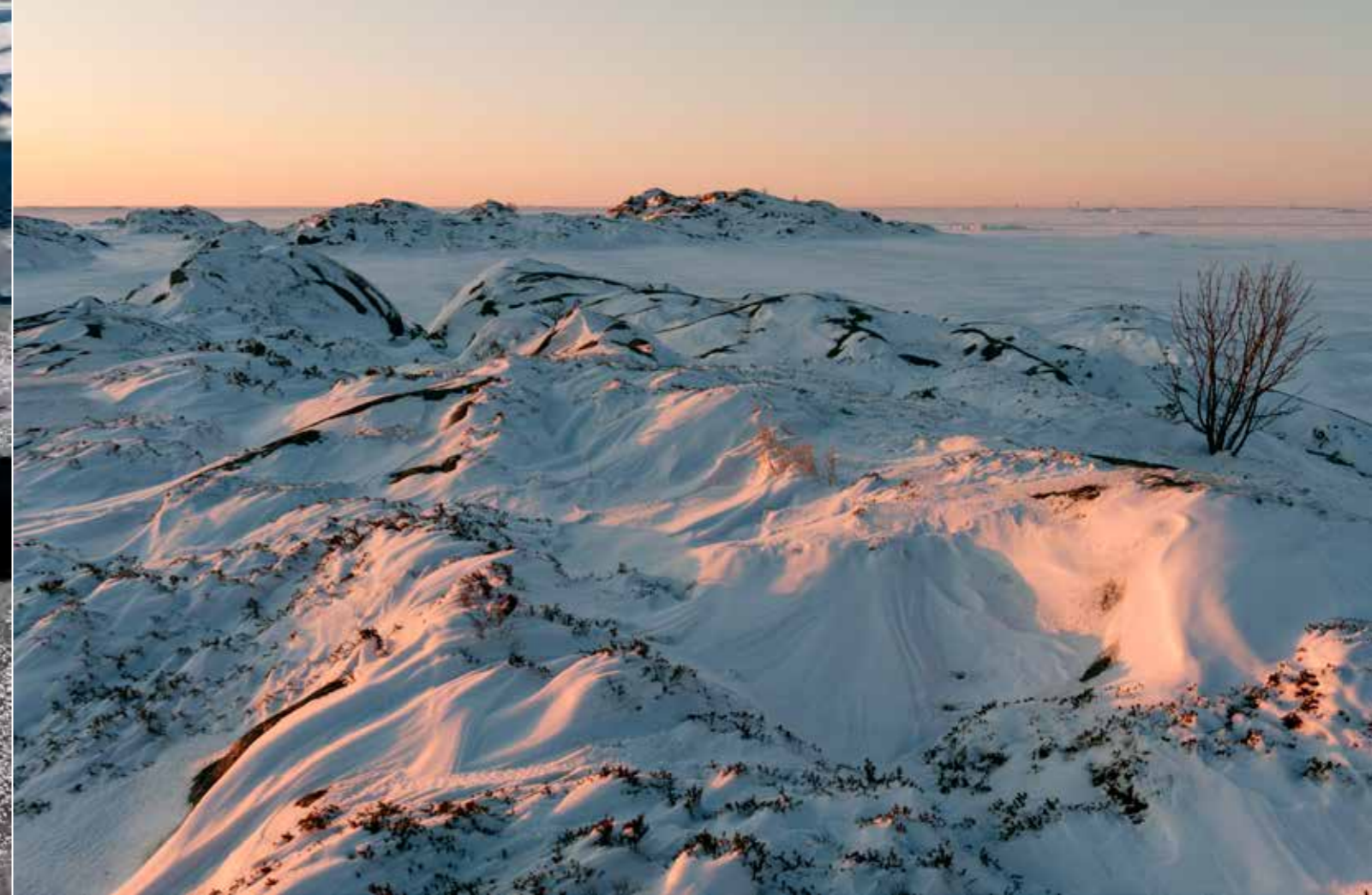
Yllä Tuulen jälkiä talvi-illassa Saaristomeren ulkoluodoilla, alla Talvinen ruovikko houkuttaa kuvaajaa sommitteluharjoituksiin.

Yhden valokuvaajan maastokestävyysaika on riittämätöntä arvioon arkkipelagin talvista, mutta 2000-luvun kehnot jäät ja lumet saaristossa ovat surettaneet ja epäilyksiä herättäneet. Jääkö kuvaajan vuoden graafisin jakso entistä lyhyemmäksi ja huonommaksi samalla kun välineet mahdollistaisivat entistä osuvampia