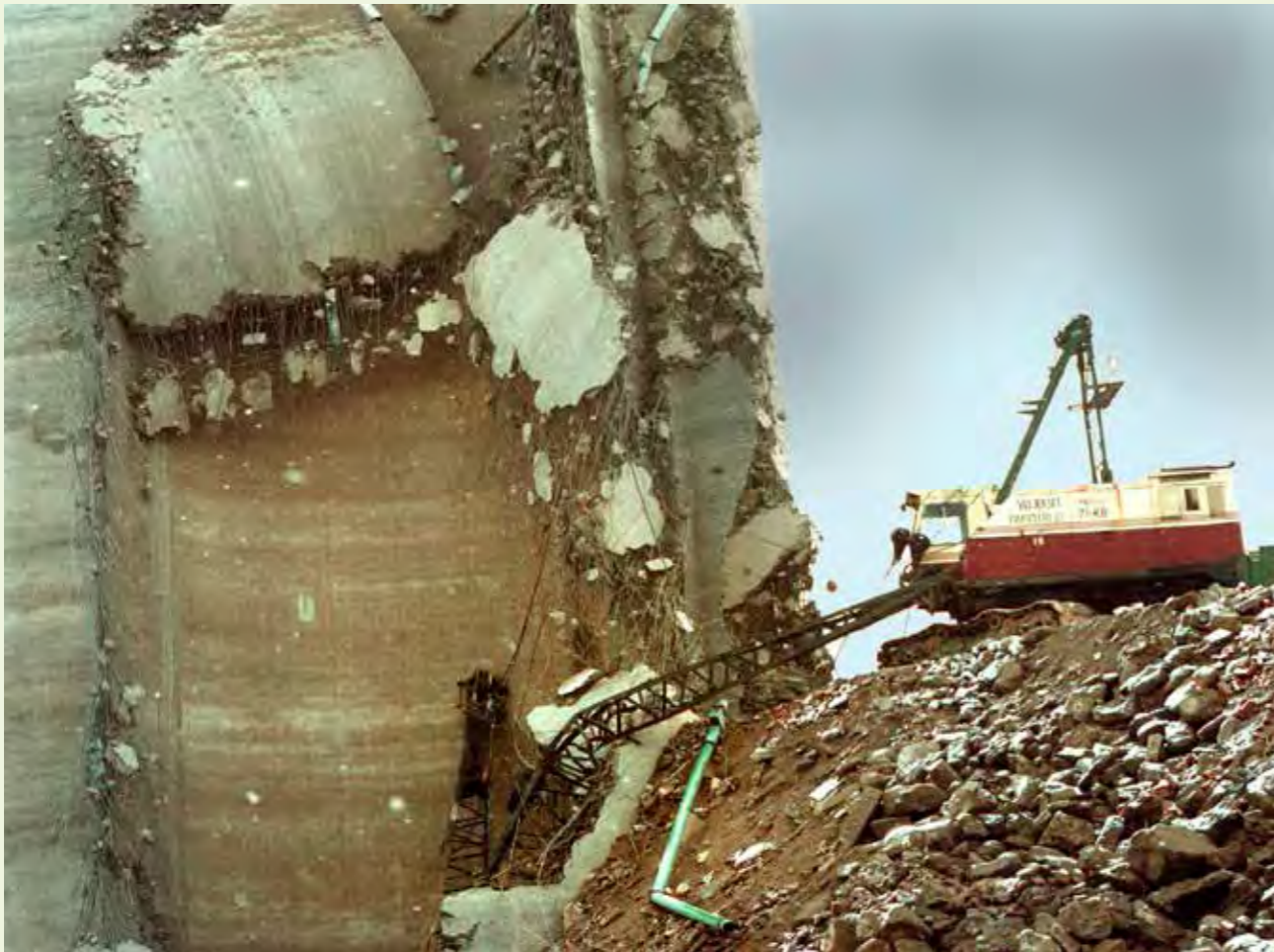
Tampereen Hatanpäässä purettiin siiloja maaliskuussa 1998. Työn vaativuudesta kertonee, että toinen puomeista oli kuvanottohetkellä jo solmussa.

Lehtikuvaajan uralla päätyemisestä Iso-Ettala saa kiittä edesmennyt äitiään. - Äitini oli nähnyt Länsi-Suomessa ilmoituksen, jolla lehteen haettiin valokuvaajajohjoittelijaa. Kävin mopollani toimituksessa, mutta käynnistä ei jäänyt kovin vahvaa tunnetta.