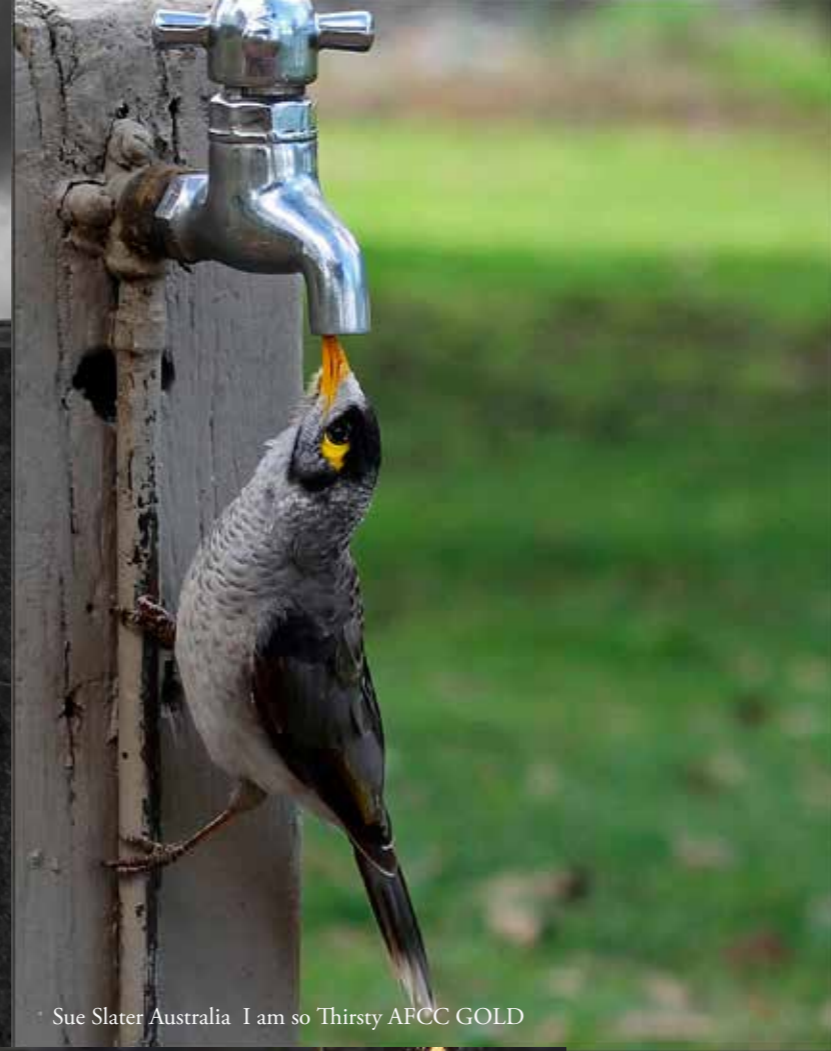
Sue Slater Australia I am so Thirsty AFCC GOLD