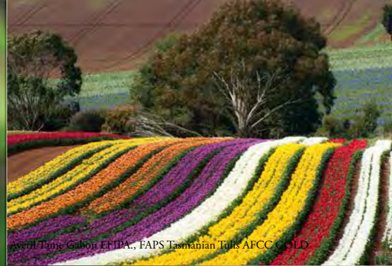
Averil Tame Gabon EFIBA., FAPS Tasmanian Tulis AFCC GOLD