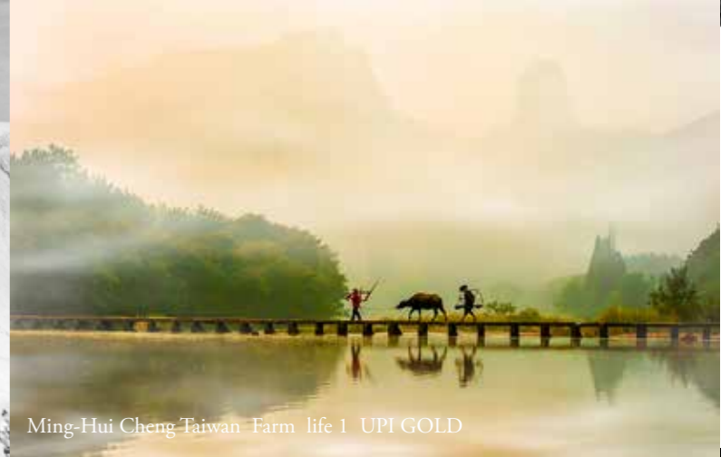
Ming-Hui Cheng Taiwan Farm life 1 UPI GOLD