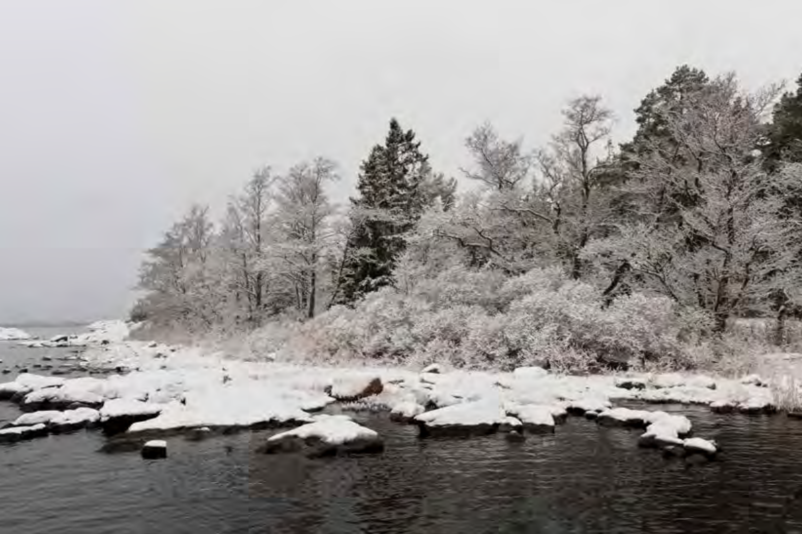
Öinen lumisade on vaihtanut saariston valkeisiin lakanoihin Kuusisessa Suokarissa