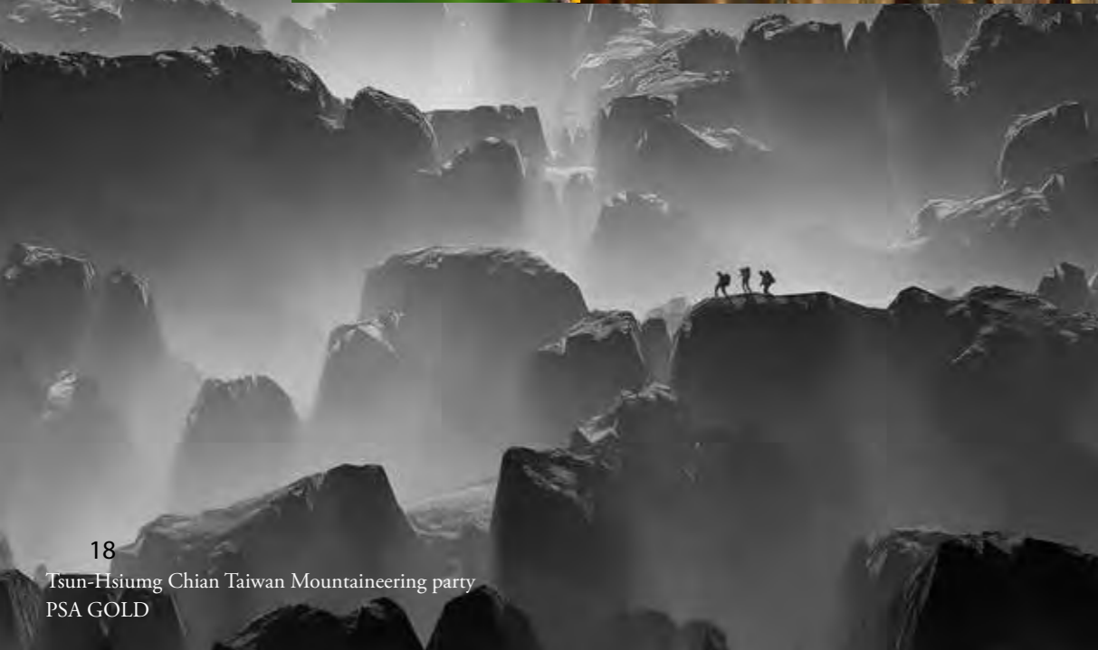
18 Tsun-Hsiung Chian Taiwan Mountaineering party PSA GOLD